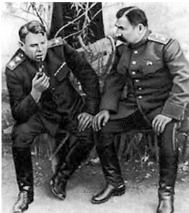
Семён Будённый с маршалом Василевским

Участвуя в решении вопросов строительства Вооружённых Сил СССР, их технической реконструкции, преувеличивал роль кавалерии и недооценивал техническое перевооружение армии, не одобрял формирование танковых соединений.