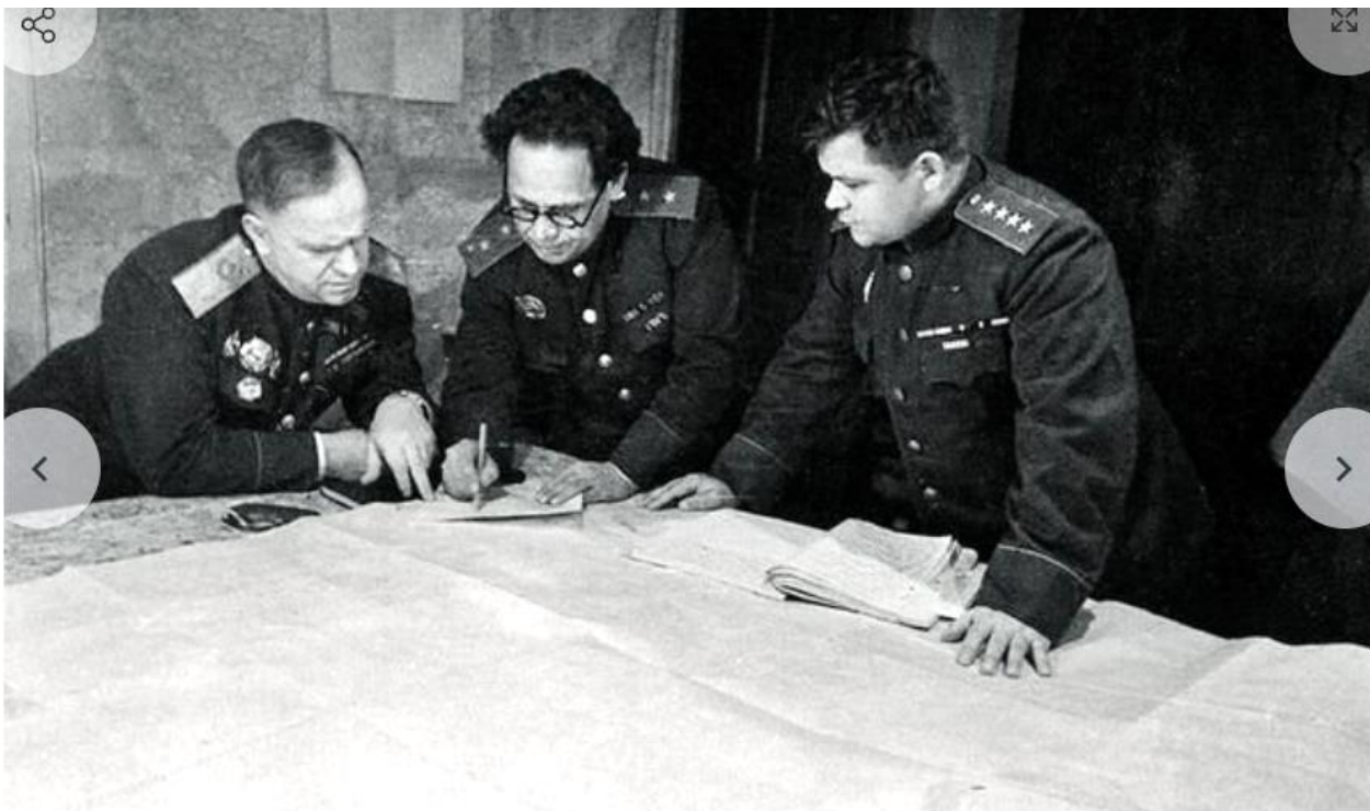
Обсуждение оперативных планов с Г.К. Жуковым. В центре - начальник штаба фронта генерал-лейтенант А. Боголюбов. 1943 г.