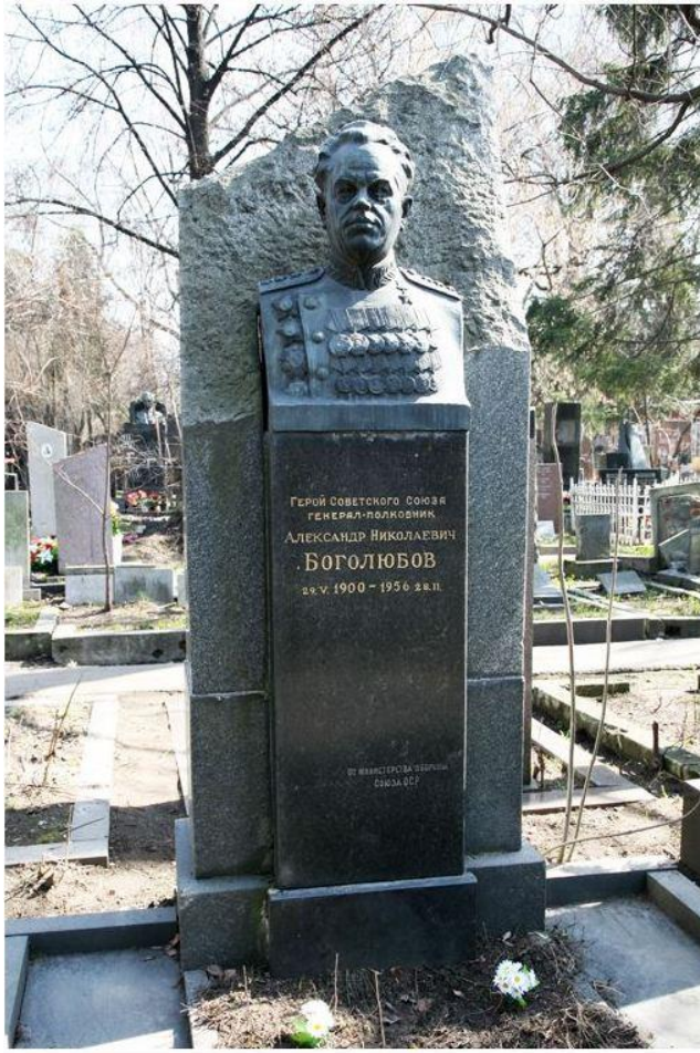
Установлен на Новодевичьем кладбище (участок 4) в Москве.